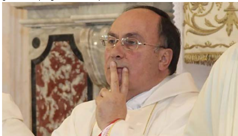
Don Angelo Giurdanella

Al momento non è nota la data di insediamento del nuovo vescovo, di conseguenza la sede episcopale è vacante cioè non ha un vescovo suo proprio, nel frattempo monsignor Mogavero sarà amministratore apostolico con tutte le facoltà di un vescovo diocesano, quindi fino all'insediamento del nuovo vescovo non cambierà nulla.