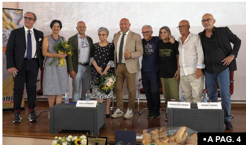
■ A PAG. 4

Dal 7 all'11 Agosto, Borgata Costiera - Street food Valley