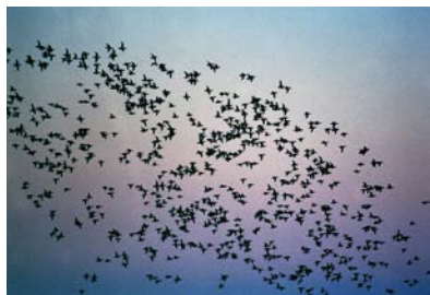
Marzaiole al tramonto quando frequentavano lo Stagnone

A i sensi di legge: "Possono essere istituiti in riserve naturali quei territori e luoghi, sia in superficie che in profondità nel suolo e nelle acque, che per ragioni di interesse generale specialmente d'ordine scientifico, estetico ed educativo vengono sottratti all'incontrollato intervento dell'uomo e posti sotto il controllo dei poteri