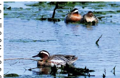
L'attraente livrea del maschio di marzaiola che dava un tocco di colore in più allo Stagnone, attraendo tanti appassionati

delle tavole del kite. Dopo che nella riserva dello Stagnone è stato concesso di tutto e di più, almeno per quanto si può osservare, si poteva dire di no al "pub galleggiante" che "di giorno funzionerà" come prima, mentre la sera, dopo la navigazione per "ammirare lo specchio d'acqua e il tramonto con un calice di vino in mano, si trasformerà in un softpub galleggiante"?