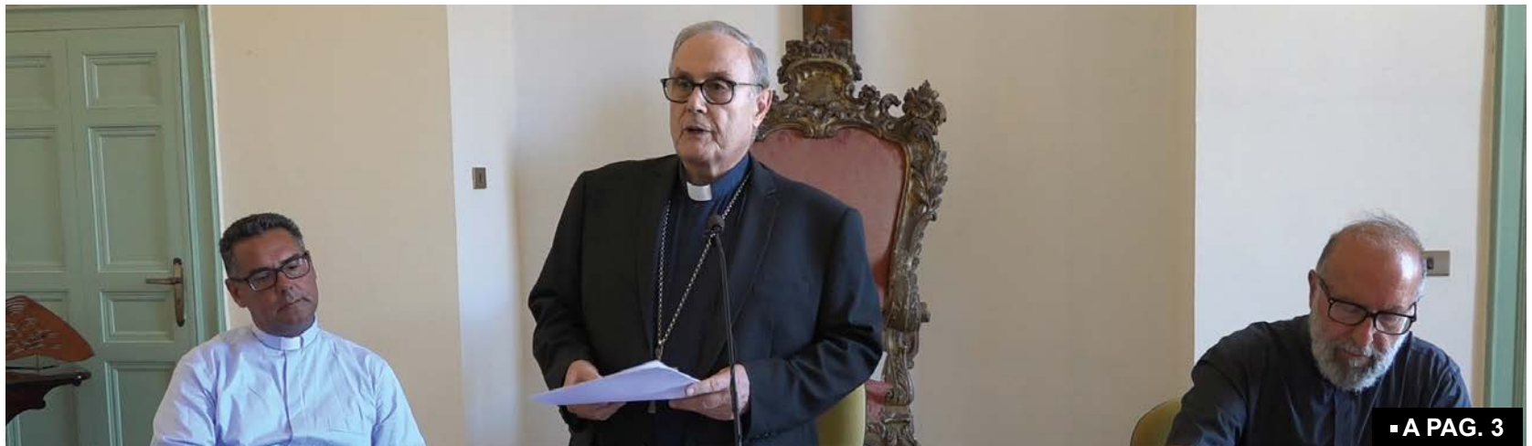
■ A PAG. 3