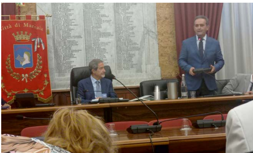
da sx il Presidente della Regione Siciliana Nello Musumeci e il Sindaco di Marsala Massimo Grillo

“Un pezzo di mosaico utile ed interessante, ben inserito nel contesto della storia siciliana e marsalese in particolare. Una pubblicazione che offre notizie inedite, curiosità, aneddoti e un invidiabile, cospicuo corredo iconografico che recupera e immortala personaggi, eventi, cronaca politica e sociale, manifestazioni artistiche e culturali. Che racconta l'evoluzione del territorio con una chiara stesura dalla vena aulica e puntigliosa”, “Pietro Pizzo - l'uomo, la politica”, la nuova biografia di Attilio L. Vinci è un libro è stato così presentato, mercoledì 13 luglio nella Sala delle Lapidi di Palazzo VII aprile a Marsala, dal Governatore della Sicilia, on. Nello Musumeci, dal deputato Regionale Stefano Pellegrino e dallo stesso senatore Pietro Pizzo. È supportato da brevi interventi del sindaco Lilybetano on. Massimo Grillo e dal presidente del Consiglio comunale dott. Vincenzo