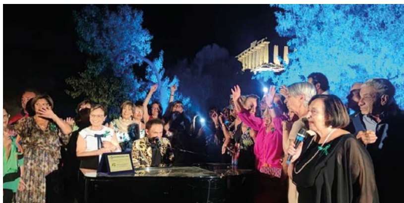
Le socie del Centro Guttuso cantano con Roby Facchinetti