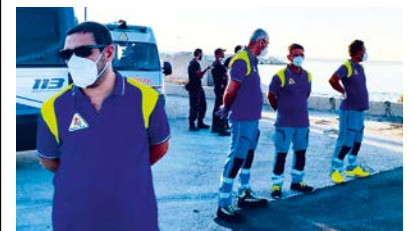
di Roberto Marrone

Durante tutta l'estate arriveranno migranti da Lampedusa