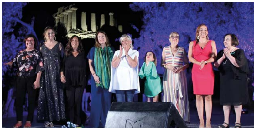
Tutte le premiate della Mimosa d'oro 2022