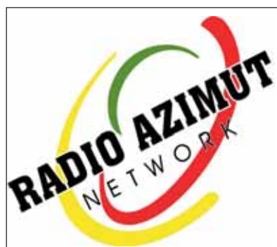
Franco Lo Re

Ma che non permette loro però il ritorno in possesso delle aree. Già. Perché nel frattempo l'Agenzia nazionale per l'amministrazione e la destinazione dei beni sequestrati e confiscati alla criminalità organizzata ha deciso di annullare il provvedimento con il quale ne aveva disposto, 4 anni prima, il trasferimento al patrimonio indisponibile del Comune di Salemi." Di paradosso in paradosso, come si vede, tutta la vicenda solo apparentemente ha assunto i contorni di un racconto alla Camilleri. Se li avesse assegnati questi terreni, oggi Vittorio Sgarbi siederebbe ancora sullo scranno di Piazza Dittatura. Ne siamo certi. Ma sapendo che in questa terra del barocco la forma è anche sostanza ha dovuto rinunciare, con buona pace del suo Museo della Mafia.