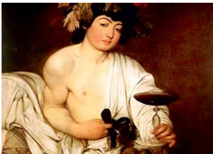
di Francesco Mezzapelle

“...Prima calàticci a testa e poi chiamate il 118”